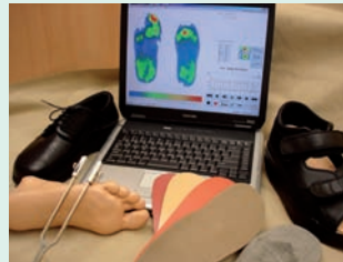
Moderne Software unterstützt die Maßarbeit

Die Erfahrung eines Handwerks mit Tradition, die stetige Zusammenarbeit mit Medizinern, Physiotherapeuten, Sportwissenschaftlern und der Einsatz moderner Technologien, z. B. die elektronische Fußdruckmessung oder die Streifenlichtprojektion, macht den Orthopädieschuhtechniker zu einem kompetenten Berater, um „Bayern auf gesunde Füße zu stellen“!